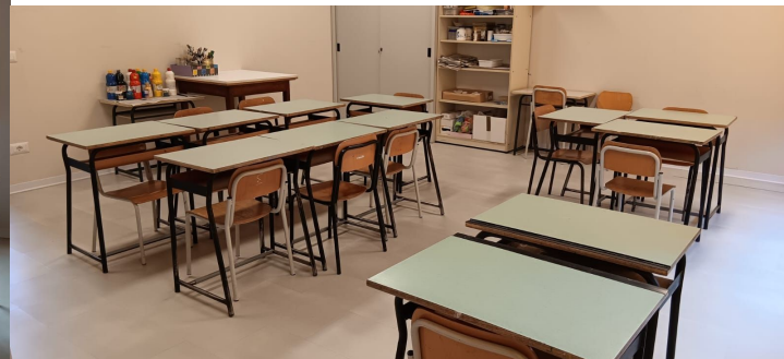
l'aula di arte