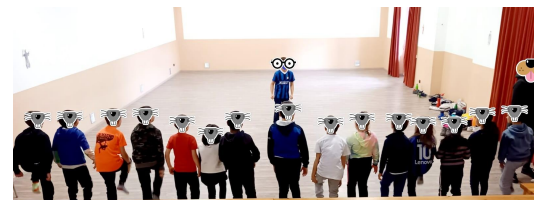
l'aula di matematica per la motoria abbiamo a disposizione il salone dell'oratorio e il campo da calcio del paese